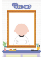
· 얼굴 그림